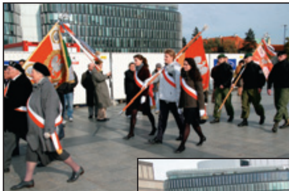
Poczty sztandarowe przed Grobem Niezanego Żołnierza