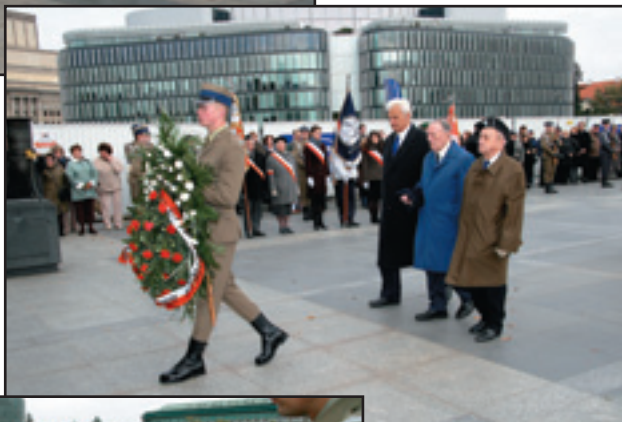
Wieniec na Grobie Niezanego Żołnierza złożono w imieniu Dyrekcji, Stowarzyszenia Wychowanków i młodzieży