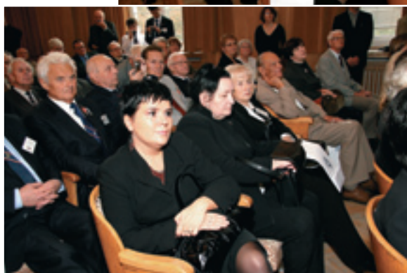
Przybyły licznie roczniki od 1932 do 2008