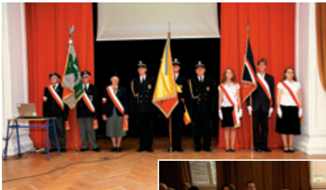
Poczty sztabdarowe: Szarych Szeregów, Straży Miejskiej i Szkoły