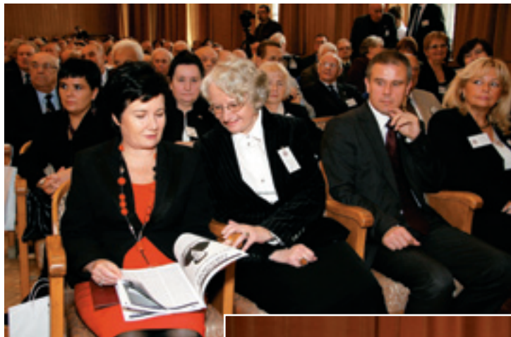
Gościem Honorowym Zjazdu była Prezydent Warszawy Hanna Gronkiewicz- Waltz