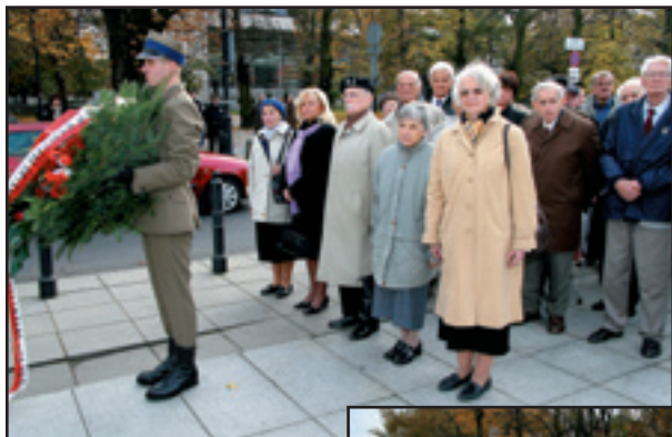
Pod Pomnikiem Polskiego Państwa Podziemnego złożono wieńce w hołdzie poległym