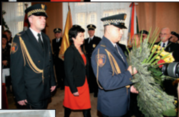
Kwiaty pod Tablicą Poległych złożyła Prezydent Warszawy H. Gronkiewicz-Waltz w asyście Straży Miejskiej