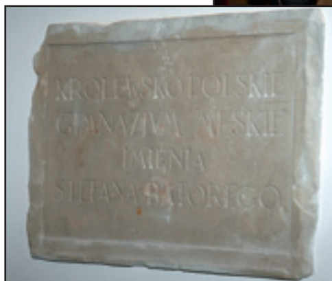
Tablica pamiątkowa z pierwszego gmachu Szkoły przy ul. Kapucyńskiej