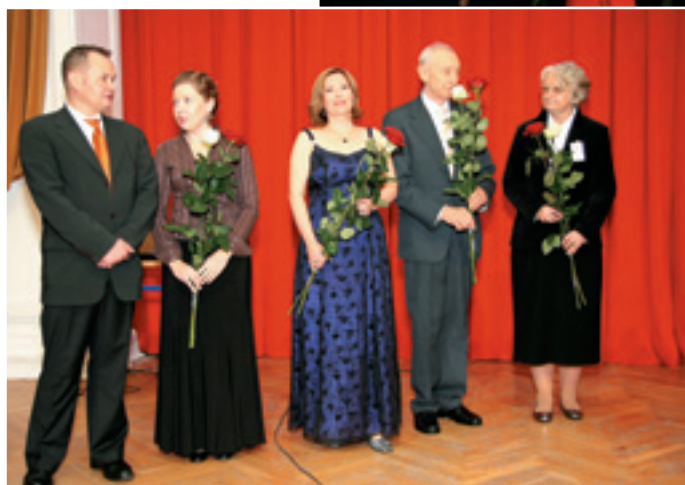
Artyści, którzy uświetnili uroczystość