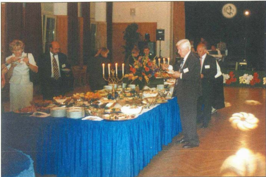
14. Wieczorny bankiet rozpoczynamy przy „szwedzkim bufecie“