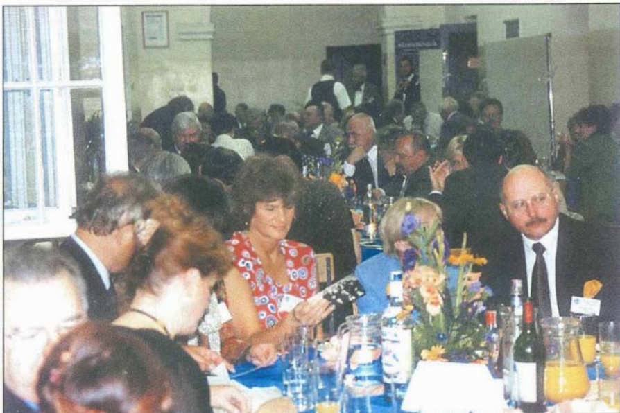
15. Przy stolikach na korytarzach tłum gości