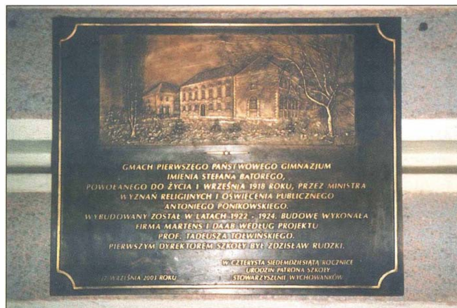
9. Oto tablica przy wejściu do szkoły