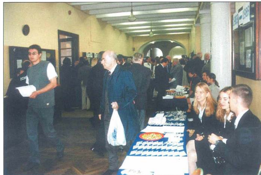
5. Rejestracja, odbiór materiałów, pierwsze spotkania...