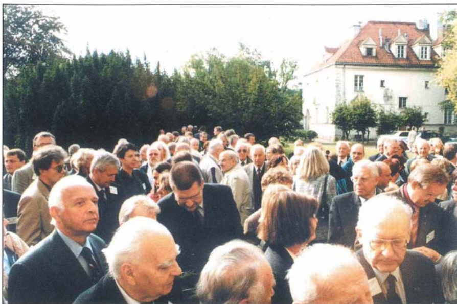
6. Tłum zbiera się na dziedzińcu