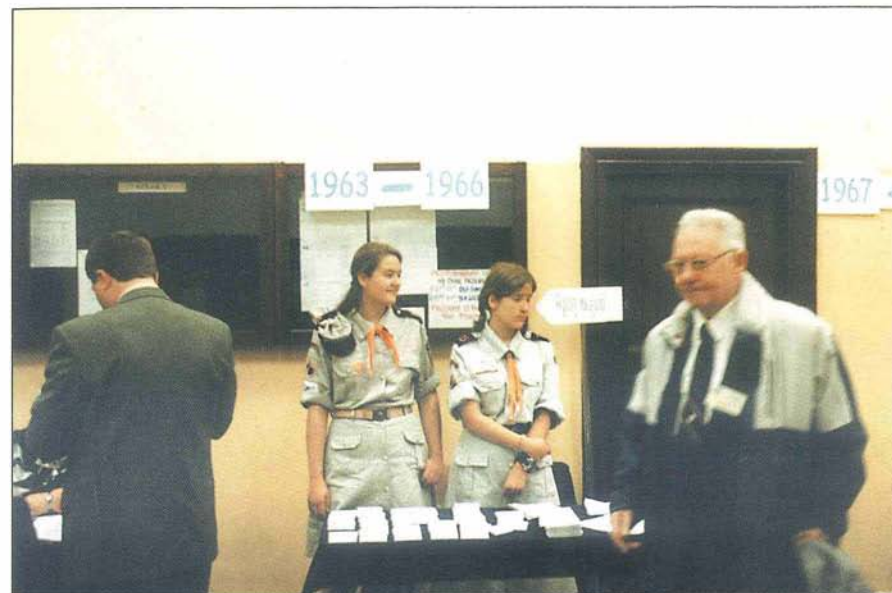
4. Już wczesnym rankiem pojawili się w holu uczestnicy zjazdu