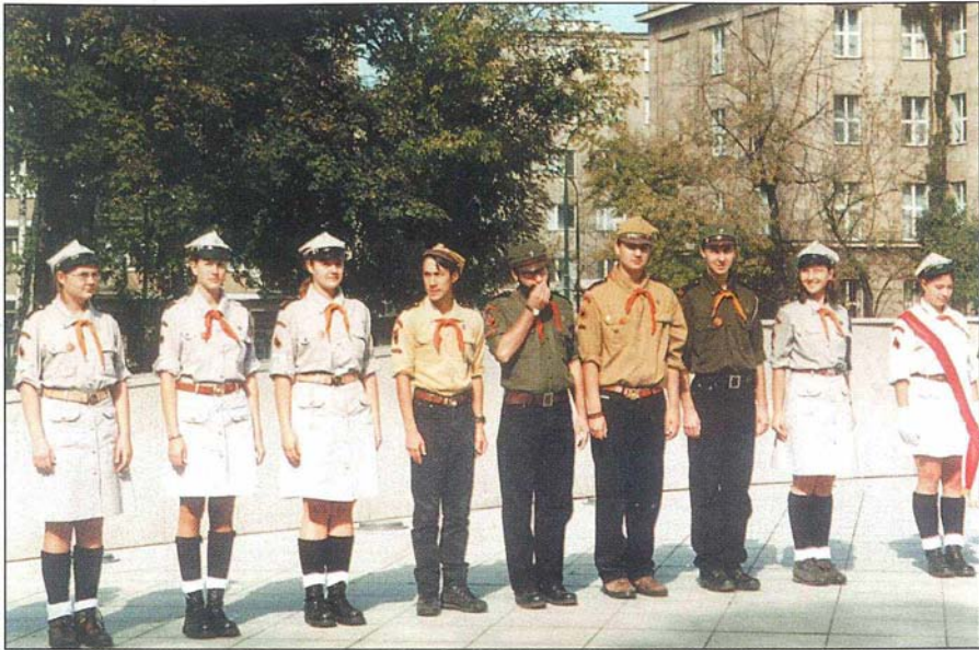
21. Harcerska warta honorowa