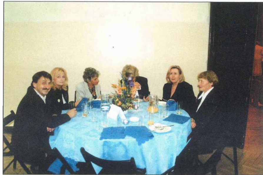
16. Stolik nauczycielski