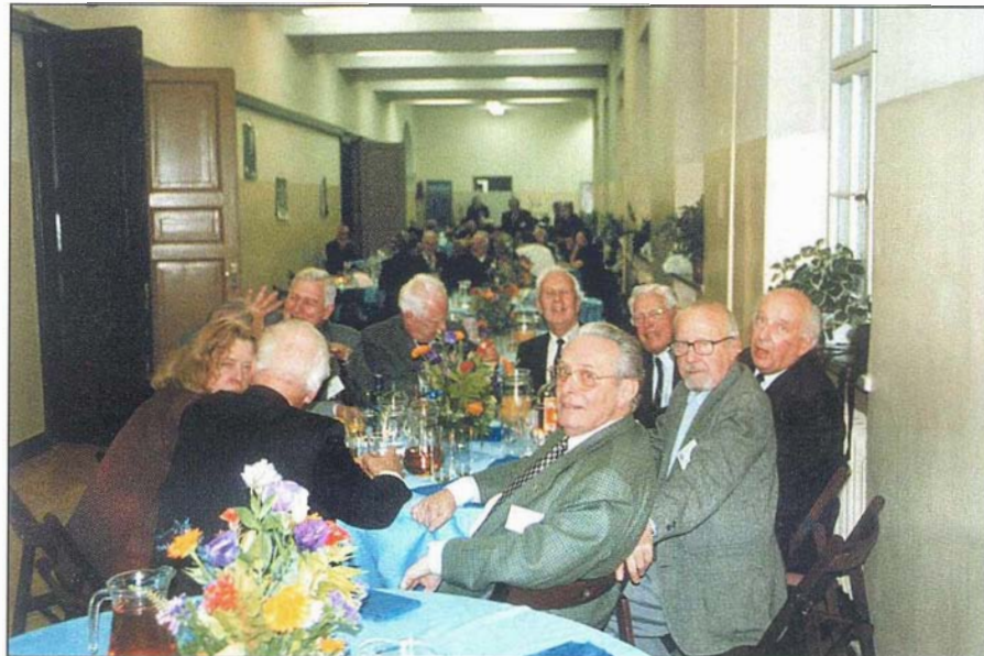
17. W bankiecie wzięty udział 492 osoby!