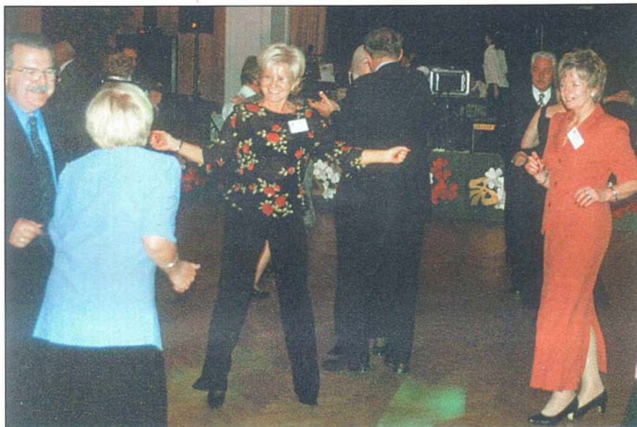
19. I przypomnienie młodości. Tańce, hulanki swawole...