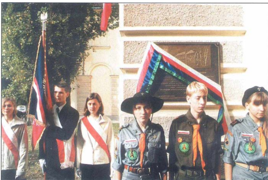
7. Harcerze na chwilę przed odsłonięciem tablicy upamiętniającej powstanie gmachu szkolnego