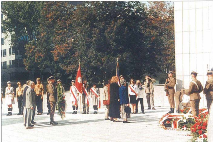
22. Delegacje składają wieńce

towanych również przez przedstawicieli 23 WDH - Pomarańczarni, podjął decyzję o reaktywowaniu całego Związku w postaci sprzed rozwiązania w latach 1949/50. Równolegle, w 1956 roku, młodzież klas gimnazjalnych, znająca historię 23 Warszawskiej Drużyny Harcerskiej im. Bolesława Chrobrego, postanowiła ponownie powołać ją do życia. Po raz pierwszy w historii jako drużynę koedukacyjną, z podziałem na zastępy żeńskie i męskie.