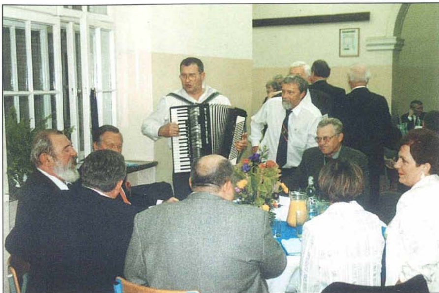
18. Dobra muzyka umiała zabawę