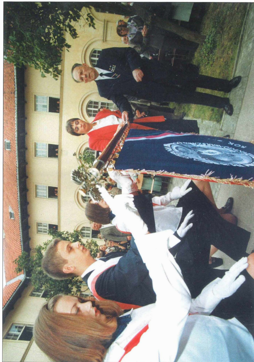
18. Uczniowski poczet sztandarowy złożył uroczystą przysięgę.