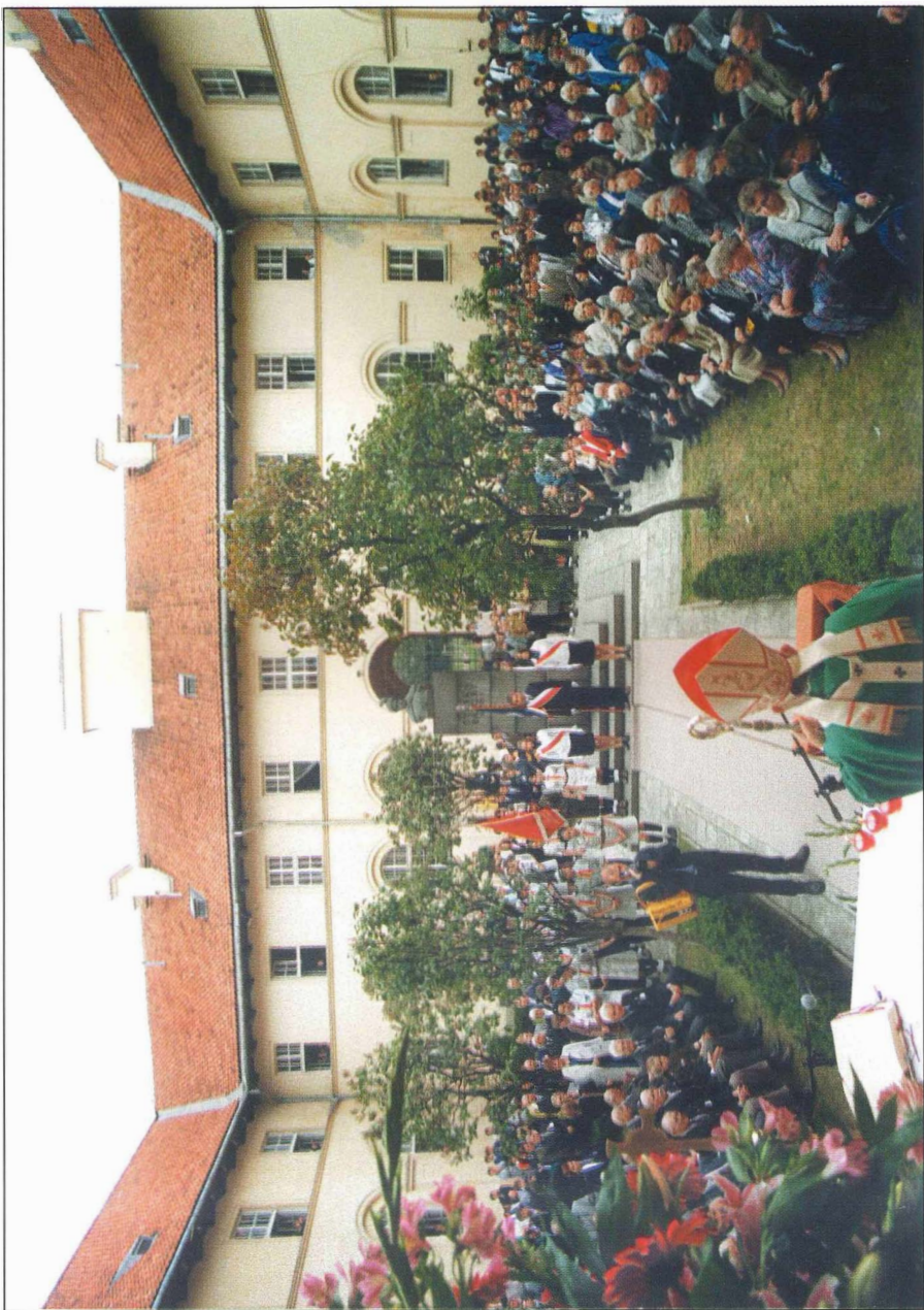
17. Uroczysta msza św. na wewnętrznym dziedzińcu Szkoły.