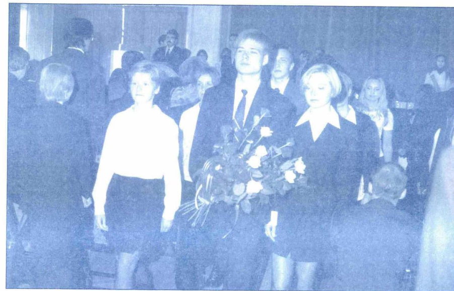
Delegacje urodziwej młodzieży szkolnej złożyły kwiaty pod Tablicą Poległych i popiersiach króla Stefana Batorego.