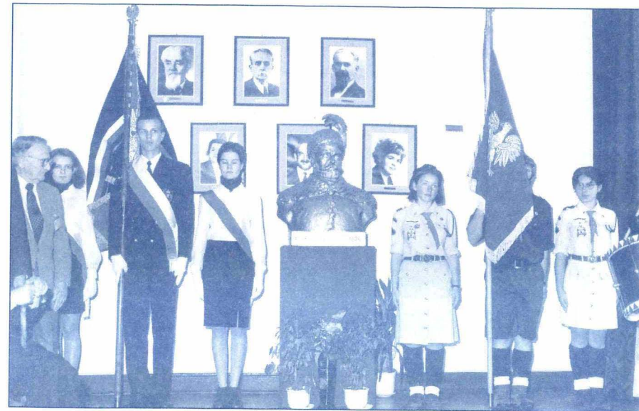
Poczty sztandarowe podczas Apelu Poległych kończącego uroczystości 80 lecia Gimnazjum i Liceum im. Stefana Batorego w Warszawie.

Życzenia niektórych uczestników Zjazdu aby podać również adresy wyżej wymienionych osób nie mogą być spełnione wobec obowiązujących ustaw. Stowarzyszenie dysponuje adresami Koleżanek i Kolegów z powyższej listy i może pośredniczyć w uzyskaniu takich danych.