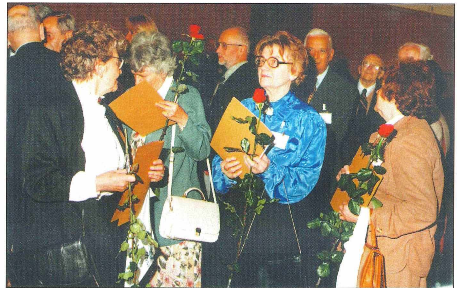
9. Pamiątkowe dyplomy rozdano. Maturzyści z roku 1948 zadumani nad przeszłością.