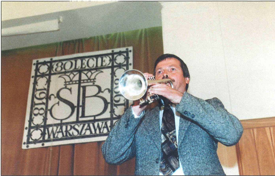
2. Hejnał batoracki otwierał uroczystości Święta Szkoły oraz Zjazdu Wychowanków.