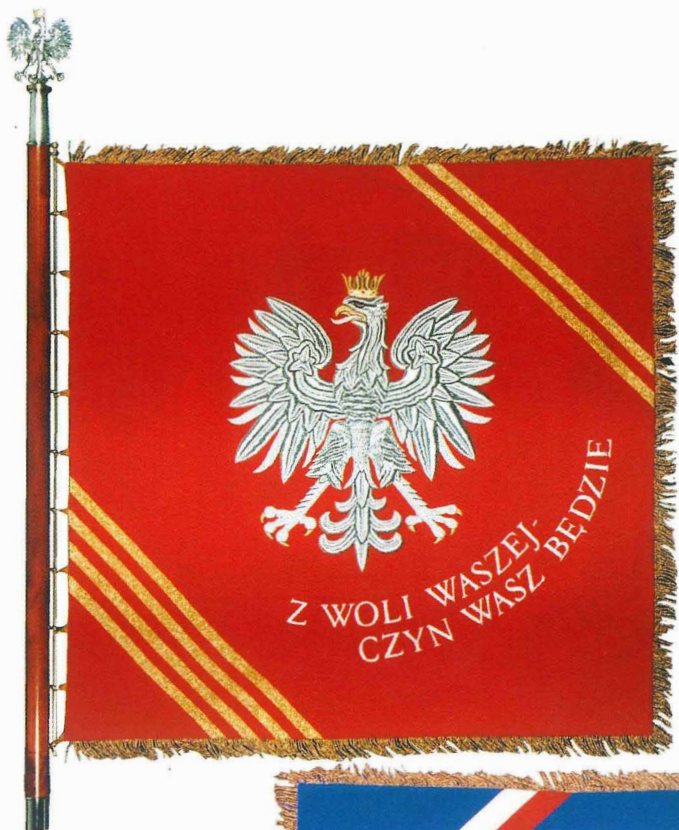
25. Nowy sztandar szkolny projektu Zbigniewa Wilmy. Awers