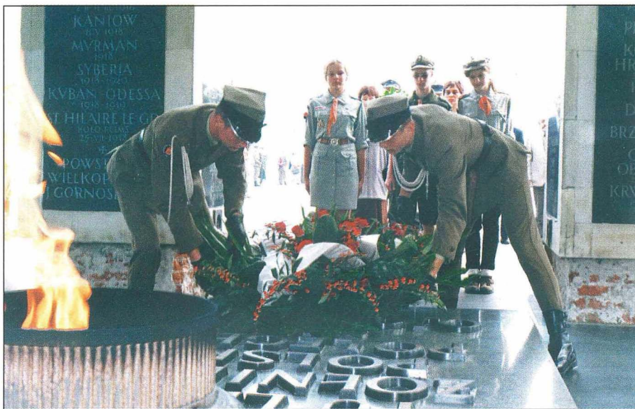
14. Składanie wieńców od Dyrekcji Szkoły, Stowarzyszenia Wychowanków, Samorządu Uczniowskiego.