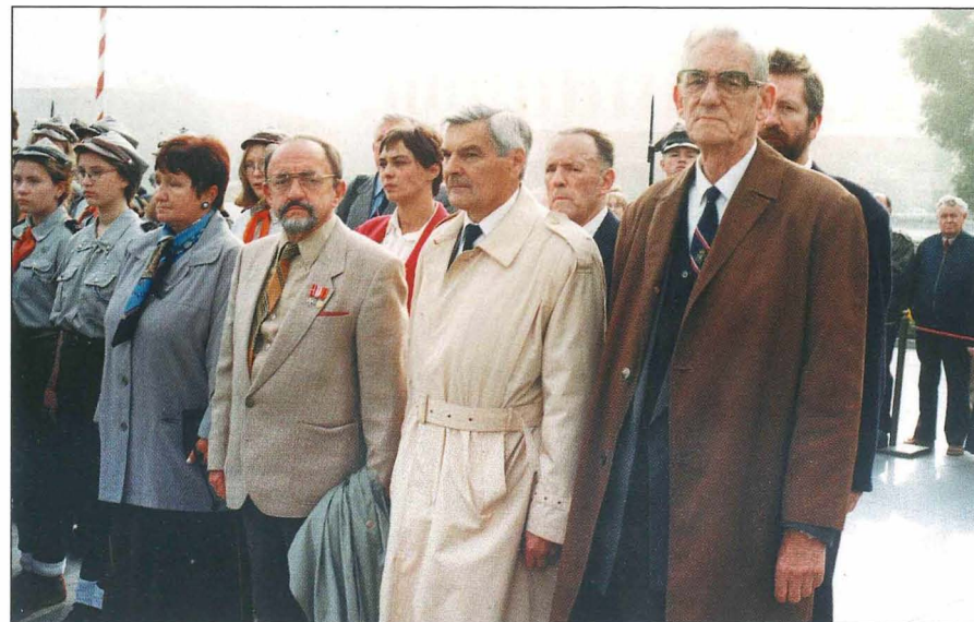
15. Delegacje składające wieńce po wpisaniu się do księgi pamiątkowej.