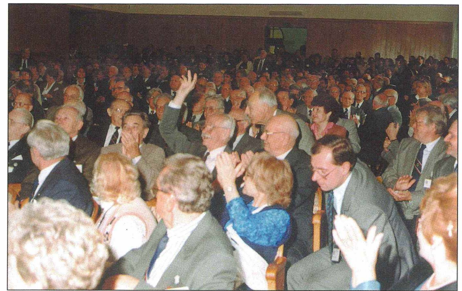
8. Widownia pełna życia.