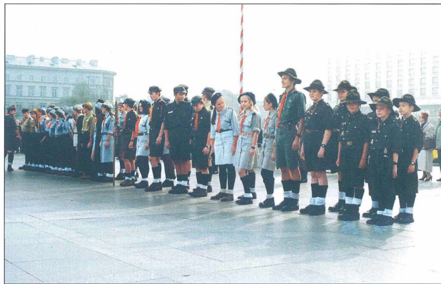
16. Szczep Pomarańczarni na Placu Marszałka Piłsudskiego.